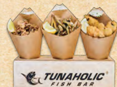
SARDELLEN | KALAMARE | ÄHRENFISCHE