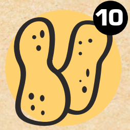
10 KIKIRIKI PEANUTS