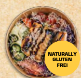
TELLER ST. EUFEMIJA