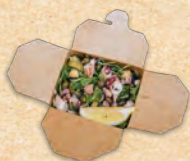
SALAT PORTA NOVA