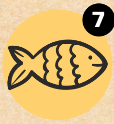
7 RIBA FISH