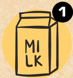
1 MLIJEKO I MLIJEČNI PROIZVODI MILK & PRODUCTS