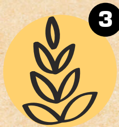
3 GLUTEN GLUTEN