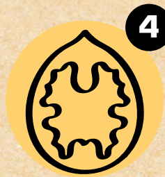
4 ORAŠASTI PLODOVI NUTS