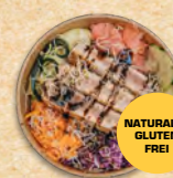
TELLER ST. ELEUTERIJE