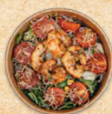
SALAT 2 SAINTS