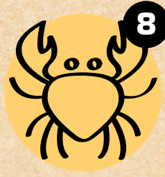
8 RAKOVI CRABS