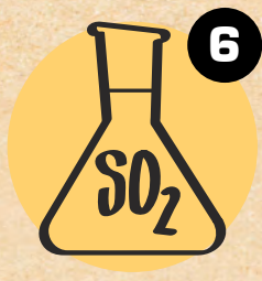
6 SO2 SUMPOR DIOKSID SULPHITE