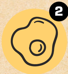
2 JAJA EGGS