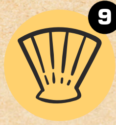
9 MEKUŠCI I ŠKOLJKE MOLLUSC & SHELL