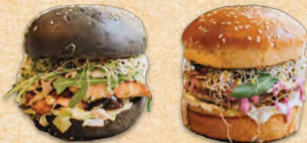
LACHS BURGER PARENTINO