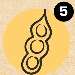
5 SOJA SOYA