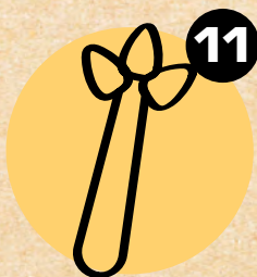
11 CELER CELERY