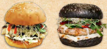
HAI FISCH BURGER PREDOL