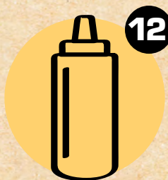
12 GORUŠICA MUSTARD