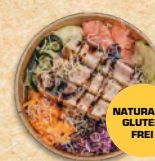
TELLER ST. ELEUTERIJE