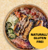
TELLER ST. EUFEMIJA